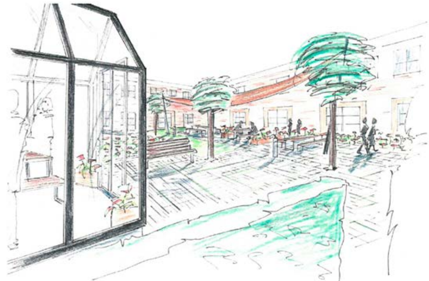
INDERGÅRD 2 TEGNING NR 02