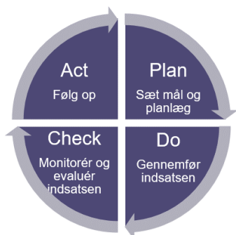
Figur 1. Kvalitetsarbejdet følger kvalitetscirklen. Kvalitetscirklens udmøntning er beskrevet i dokumentet "Overordnede rammer og processer for kvalitetsarbejdet".