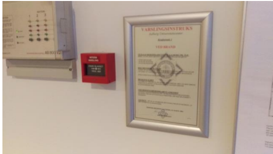
Foto 1. Eksempel på brandtryk.

Denne varslingsmetode anvendes både i nogle bygninger og i det fri. Varslingen bør efter omstændighederne gives på flere sprog – som minimum på dansk og på engelsk.