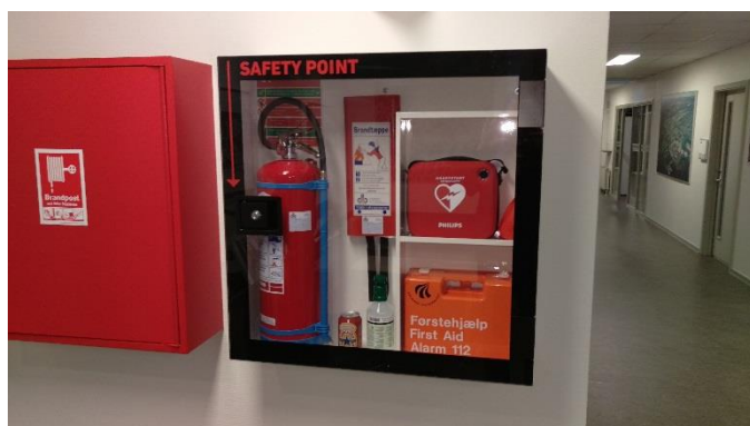
Foto 3. Safety Point

Indholdet i Safety Point-skabene supplerer lokalt placeret beredskabsrelateret udstyr.