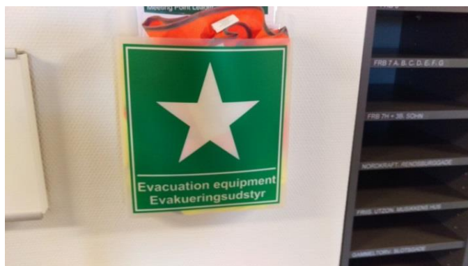
Foto 2. Væghængt evakueringsudstyr.

I alle AAU's bygninger er der – ofte flere steder i bygningerne – ophængt evakueringsudstyr. Evakueringsudstyret understøtter en evakueringsopgave i bygningen eller i dele af bygningen.